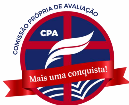
Figura 3 - Selo de conquista da CPA.

Os resultados das avaliações institucionais deverão ser divulgados obedecendo as estratégias estabelecidas no plano de divulgação e apropriação dos resultados, garantindo a transparência e favorecendo a apropriação destes pelo público-alvo. A CPA deverá ainda garantir canais de diálogo aberto com a comunidade e divulgar as melhorias obtidas, a partir da execução do planejamento estratégico, com a afixação do selo de conquista da CPA (Figura 3).